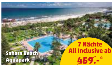
Sahara Beach Aquapark