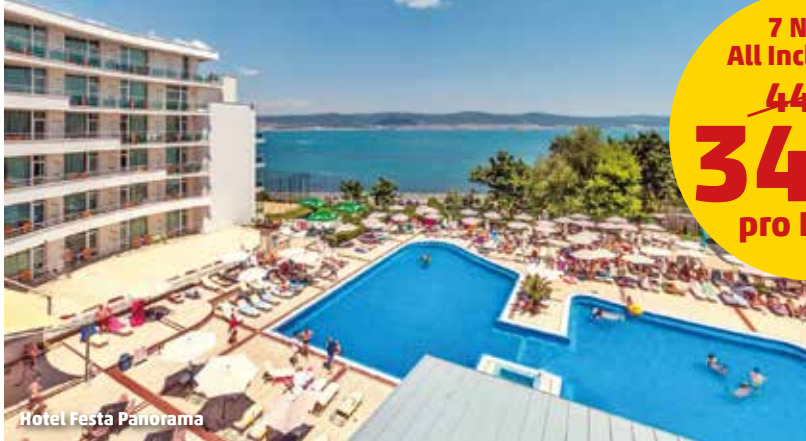
Hotel Festa Panorama

Perfekte Lage unweit der Altstadt Nessebars