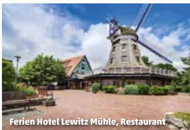
Ferien Hotel Lewitz Mühle, Restaurant