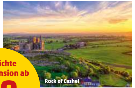
Rock of Cashel