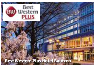
Best Western Plus Hotel Bautzen