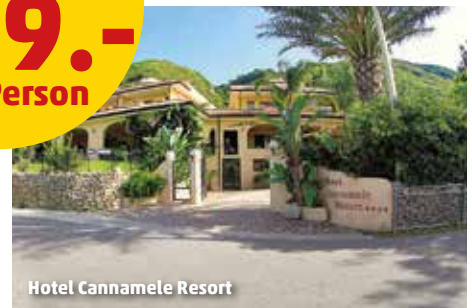
Hotel Cannamele Resort

7 Nächte Halbpension ab 544.-* 419.- pro Person