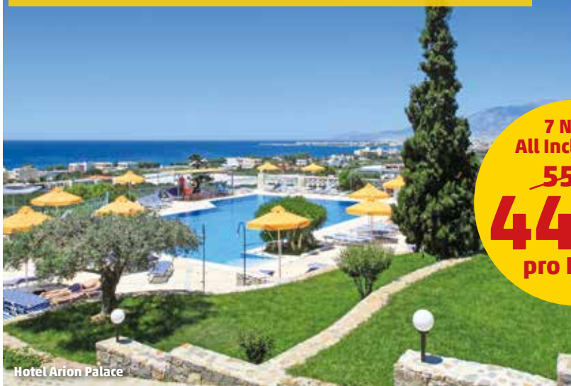
Hotel Arion Palace