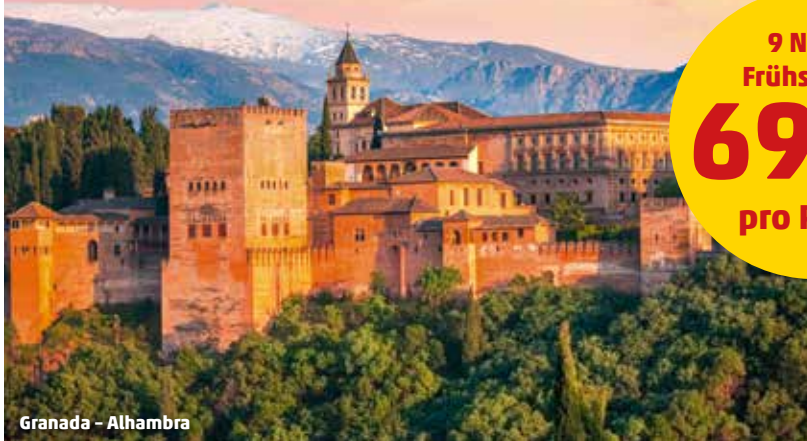
Granada - Alhambra