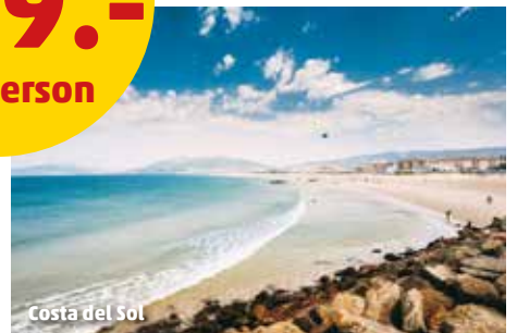
Costa del Sol