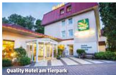
Quality Hotel am Tierpark

Kulturförderabgaben vor Ort zu zahlen. Einzelzimmerzuschläge, Kinderermäßigung und 1 Nacht ab € 75.- unter penny-reisen.de