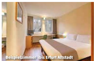
Beispielzimmer ibis Erfurt Altstadt