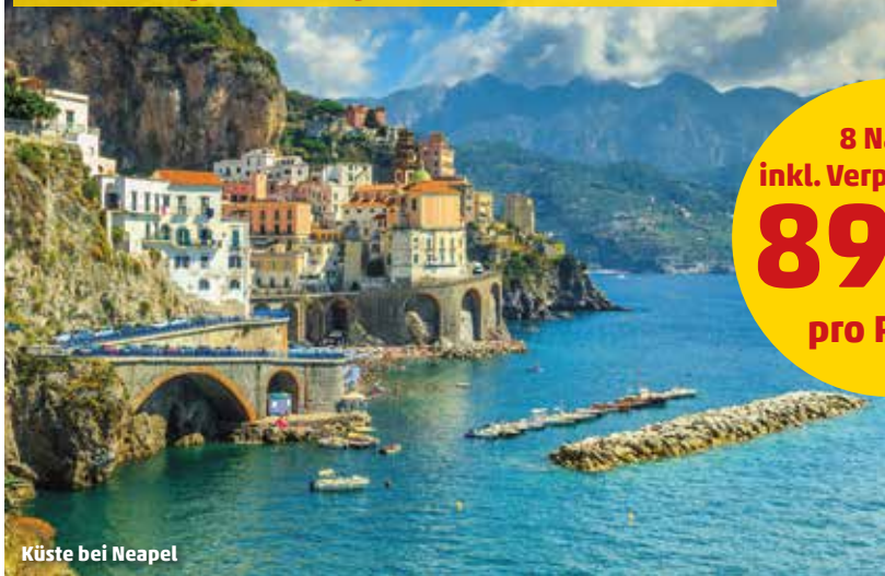
Küste bei Neapel

Inkl. 1 Nacht in Barcelona & All Inclusive Getränkepaket Easy an Bord (Wert € 224.-)