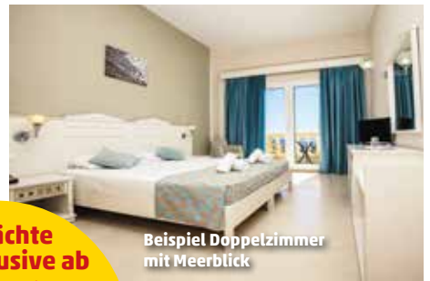
Beispiel Doppelzimmer mit Meerblick