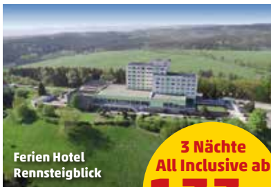
Ferien Hotel Rennsteigblick

85% Weiterempfehlungsrate Stand 02/2021 HolidayCheck ★★★★★