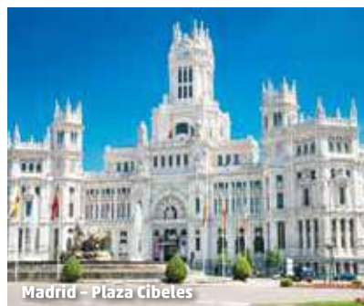
Madrid - Plaza Cibeles

Alle 4-Sterne Hotels (Landeskat.) bieten Rezeption, Restaurant, Bar sowie Doppel- (2 Vollzahler) bzw. Einzelzimmer (1 Vollzahler) mit Dusche, Klimaanlage und TV. Sie übernachten 3 x in Madrid, 2 x im Raum Sevilla, 3 x an der Costa del Sol und 1 x in Granada.