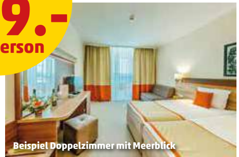
Beispiel Doppelzimmer mit Meerblick