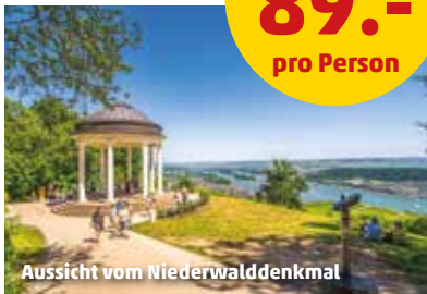
Aussicht vom Niederwalddenkmal