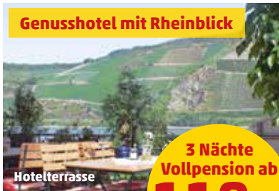
Genusshotel mit Rheinblick