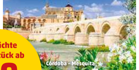
Córdoba - Mesquita