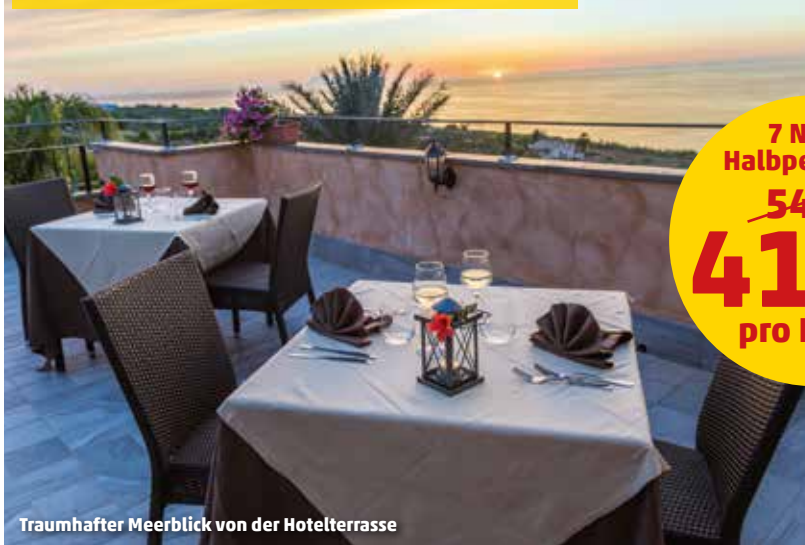
Traumhafter Meerblick von der Hotelterrasse

Meerblick-Zimmer nur € 49.- Aufpreis p.P./Woche