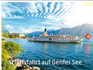
Schiffsfahrt auf Genfer See