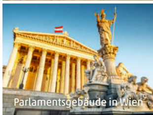
Parlamentsgebäude in Wien