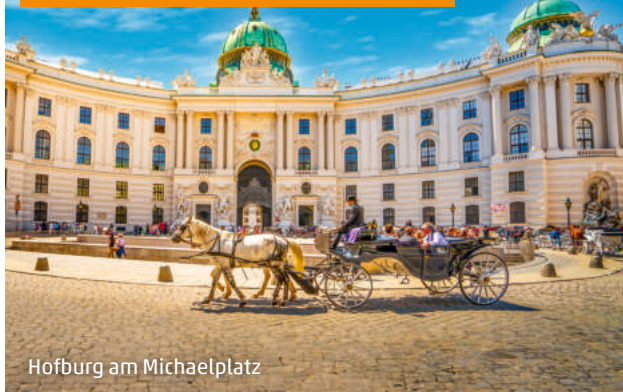
Hofburg am Michaelplatz