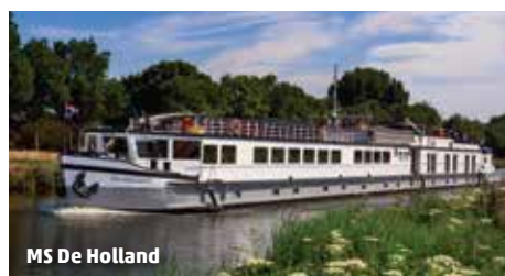
MS De Holland