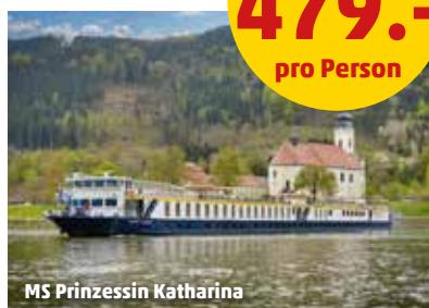
MS Prinzessin Katharina

4 Nächte All Inclusive ab 479.- pro Person