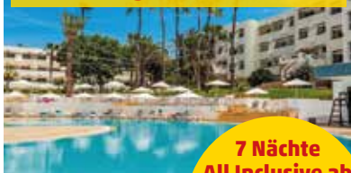
Hotel Allegro Agadir

7 Nächte All Inclusive ab 549.- pro Person