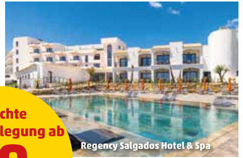
Regency Salgados Hotel &amp; Spa

9 Nächte inkl. Verpflegung ab 849.- pro Person