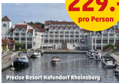
Precise Resort Hafendorf Rheinsberg

Das 4-Sterne-Superior Precise Resort Hafendorf Rheinsberg (Landeskat.) liegt direkt am Rheinsberger See. Das Resort bietet Restaurant, Bar und Sonnenterrasse mit Panoramablick, kostenfreies WLAN sowie Parkplätze (nach Verfügbarkeit), 2.300 m 2 großer Wellnessbereich mit Hallenbad, Kinderbecken, Erlebnisduschen, Sauna, Dampfbad uvm. Gg. Gebühr: Massagen, Wellness- und Beautyanwendungen. Die Doppelzimmer (min. 2/max. 2 Vollzahler + 1 Kind) verfügen über Dusche, Föhn, Minibar, Safe, Sat-TV, Balkon oder Terrasse. Die Juniorsuiten (min. 2/max. 2 Vollzahler + 1-2 Kinder) bestehen aus einem getrennten Wohn- und Schlafbereich.