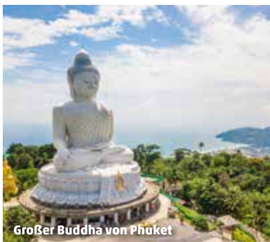
Großer Buddha von Phuket

+++UNSER SPECIAL BEI AUFENTHALT AB APRIL+++ KOSTENFREIES UPGRADE auf Doppelzimmer Deluxe Balkon (ca. 38 m 2 , min. 1/max. 2 Vollzahler) in den oberen Etagen!