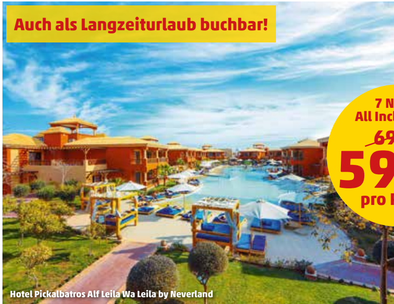
Hotel Pickalbatros Alf Leila Wa Leila by Neverland