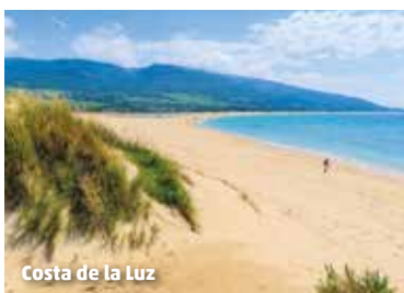
Costa de la Luz