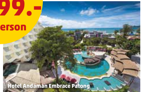
Hotel Andaman Embrace Patong