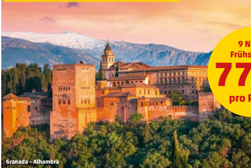
Granada – Alhambra