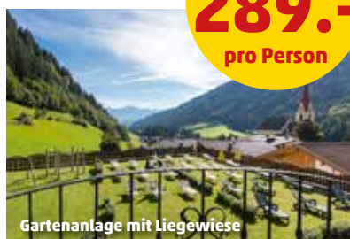
Gartenanlage mit Liegewiese

3 Nächte Halbpension ab 289.- pro Person