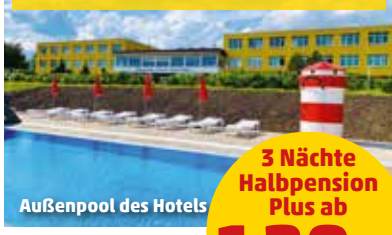
Außenpool des Hotels

3 Nächte Halbpension Plus ab 129.- pro Person