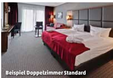
Beispiel Doppelzimmer Standard