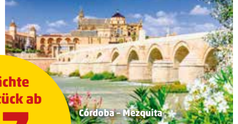
Córdoba – Mezquita