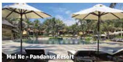
Mui Ne - Pandanus Resort