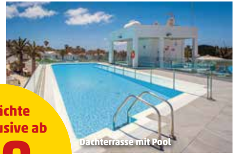
Dachterrasse mit Pool

7 Nächte All Inclusive ab 659.- pro Person