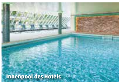
Innenpool des Hotels