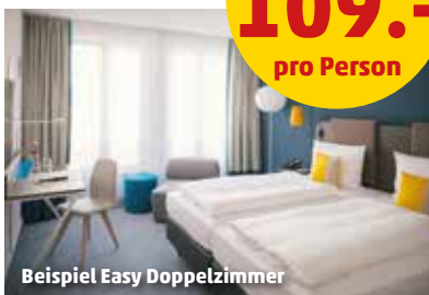
Beispiel Easy Doppelzimmer