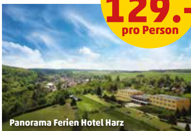
Panorama Ferien Hotel Harz

3 Nächte Halbpension Plus ab 129.- pro Person