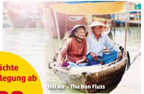
Hoi An - Thu Bon Fluss

14 Nächte inkl. Verpflegung ab 1.799.- pro Person