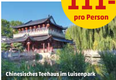
Chinesisches Teehaus im Luisenpark