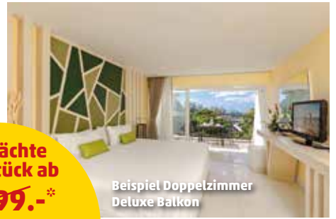
Beispiel Doppelzimmer Deluxe Balkon