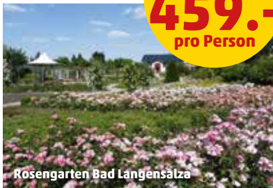
Rösegarten Bad Langensalza

5 Nächte All Inclusive Light ab 459.- pro Person