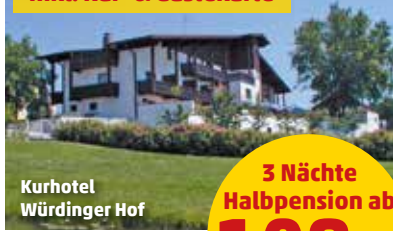
Kurhotel Würdinger Hof

3 Nächte Halbpension ab 109.- pro Person