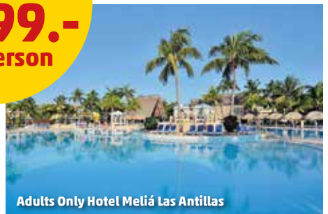
Adults Only Hotel Meliá Las Antillas