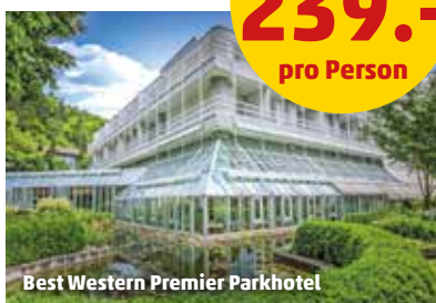
Best Western Premier Parkhotel

Das 4-Sterne-Superior Best Western Premier Parkhotel Bad Mergentheim (Landeskategorie) liegt in einer Kurparkanlage, nur wenige Gehminuten vom Ortskern und dem Schlosspark entfernt. Zur Ausstattung zählen ein Restaurant auf 2 Ebenen, Bar, Café, Innenpool, Sauna und Fitnessraum. Kostenfrei: WLAN und Parkplätze (nach Verfügbarkeit). Gegen Gebühr: Behandlungen in der Beautyfarm und Fahrradverleih. Die gemütlich und in warmen Farben eingerichteten Doppel- (2 Vollzahler) und Einzelzimmer (1 Vollzahler) sowie die geräumigeren Doppel- (2 Vollzahler) und Einzelzimmer Komfort (1 Vollzahler) sind mit Bad oder Dusche, Föhn, TV, Safe, Sitzgelegenheit und Balkon/Loggia ausgestattet.