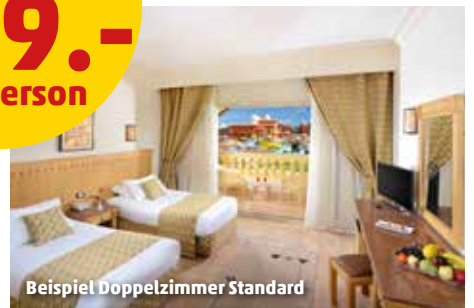
Beispiel Doppelzimmer Standard