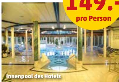
Innenpool des Hotels

Das Donna Burghotel am Hohen Bogen besteht aus einem Haupt- und mehreren Nebengebäuden. Es bietet Restaurants, Bar, kostenfreie Parkplätze (nach Verfügbarkeit) und einen ca. 2.000 m 2 großen Wellnessbereich mit Innen- und Außenpool (witterungsabhängig, nicht beheizt) und Whirlpool. Gegen Gebühr: 2022 neu erbaute Saunawelt mit diversen Saunen, Massagen und Anwendungen. Die Einzelzimmer (1 Vollzahler, Nebenhaus) bieten Bad oder Dusche, Föhn, TV und Safe. Die Doppelzimmer Standard (min. 1 Vollzahler + 1 Kind bzw. 2 Vollzahler, Nebenhaus) verfügen z.T. über Balkon oder Terrasse, die größeren Doppelzimmer Komfort (min. 2/max. 2 Vollzahler + 3. Person, Haupthaus) zusätzlich über Balkon/Terrasse. Die Familienzimmer (min. /max. 2 Vollzahler + 3./4. Person) liegen im Nebenhaus.