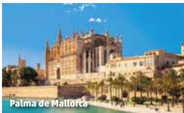
Palma de Mallorca