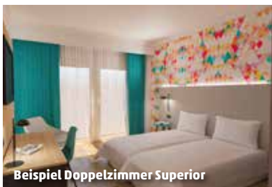
Beispiel Doppelzimmer Superior