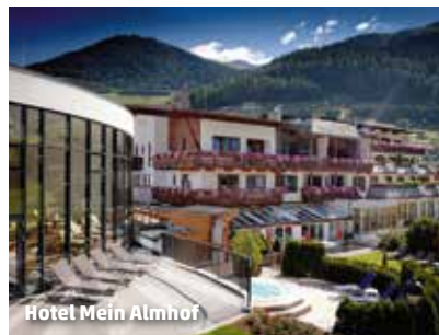
Hotel Mein Almhof

3 Nächte Halbpension ab 319.- pro Person