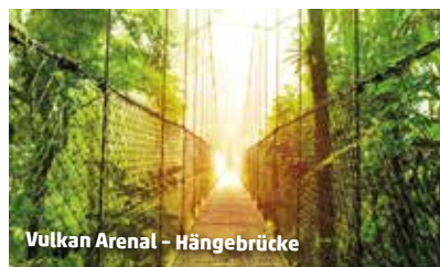
Vulkan Arenal - Hängebrücke

Badehotel: Das 3-Sterne Beispielhotel Giada (Landeskat.) in Playa Sámara (Strand: 250 m) verfügt zusätzlich über einen Pool.